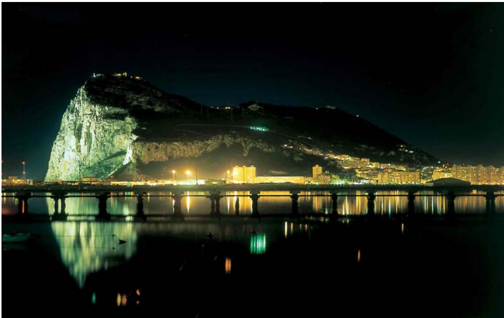
Pemerintahan Islam di Andalusia

walaupun kerajaan Islam yang memimpin majoriti umat Islam sudah beralih kepada Bani Abbasiyyah, namun Andalusia terus diungguli oleh para pemerintah dari kelompok Umayyah. Secara tidak langsung, kecemerlangan yang dibina pada peringkat awal di Andalusia terus dapat dibangunkan walaupun ada pergolakan kepimpinan yang berlaku di peringkat pentadbiran pusat sehingga pemerintahan Umayyah beralih kepada pemerintah baru. Proses mempertahankan kedaulatan rantau Andalusia agar bebas dari cengkaman Abbasiyyah dikatakan berlaku pada tahun 138H / 756M selepas kira-kira 4 dekad ia dibuka oleh pasukan Islam.